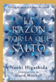
"La razón por la que salto" , Naoki Higashida (Roca Editorial- 2014)

Una historia de generosidad, solidaridad y sueños compartidos recomendable para todas las edades.