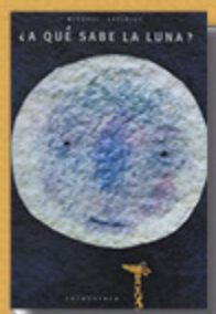
¿A qué sabe la luna? , Michael Grejniec (S.L. kalandraka editora -2011)

Una historia de generosidad, solidaridad y sueños compartidos recomendable para todas las edades.